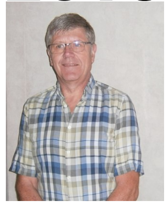
Père Wresinski, Tergnier