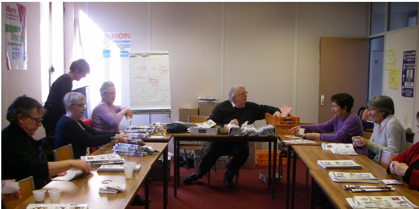
Mise sous bandeaux pour envois postaux (1)