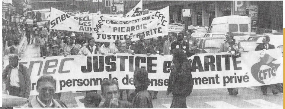
Le cortège démarre de la gare