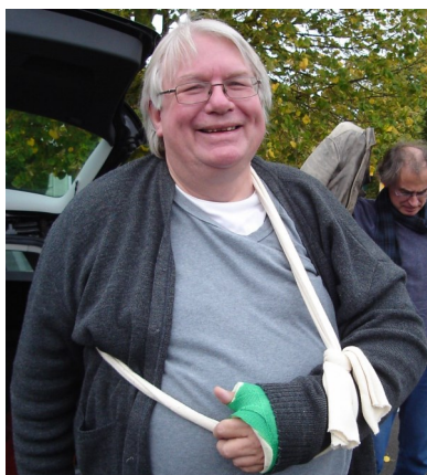
Petit accident de parcours... (2012 ?)